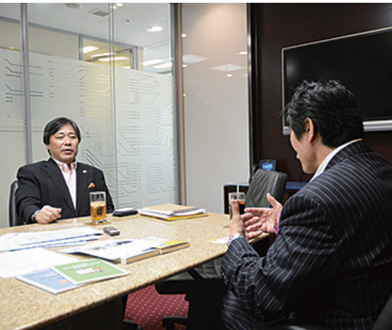
終活のワンストップ型の相談窓口として機能する『終活ニュービジネス』と言える、新しい職種が生まれました。